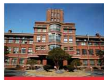
医学校区(大邱中区)