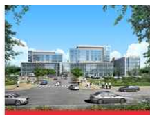
医学校区(大邱北区)