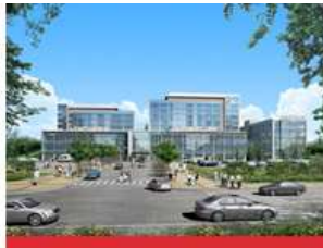
医学校区(大邱北区)