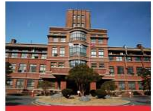
医学校区(大邱中区)